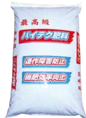
同社の有機入り肥料 「しなの」

きる有機肥料。かつては捨 てるしかない「お荷物」で した。しかし昨今は土壌や 農作物に安心ということ で、家庭菜園などで使わ れるようになりました。た だ大規模農家での使用は 少なく、そこで同社では中 国に市場を開拓。日本製 安全に敏感な富裕層を中 心に広がっていく、その勢 いは拡大しています。 さらに昨年の化学肥料 の高騰等により、国内の農 家も有機肥料に着目。ま たインターネットの楽天で 販売も始めたところ全国 から注文が入ってきます。